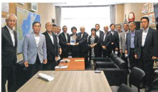
国土交通省 丹羽道路局長への要望

国道20号諏訪バイパスと国道20号下諏訪岡谷バイパスの早期完成のため、7月7日に関東地方整備局、国土交通省、財務省、地元選出議員へ、また8月10日に長野国道事務所、長野県建設部への要望活動を行いました。国土交通省の丹羽道路局長からは「未事業化区間についても事業化に向けて進めて行く。環境について十分に留意していく。」との話がありました。