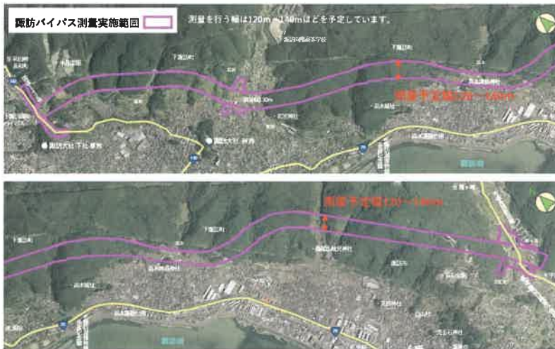
国土地理院地図(国土電子Web)