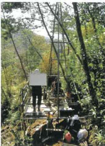
ボーリング調査の例