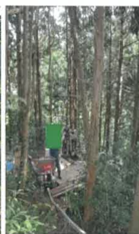
モノレールによる機材搬入の例