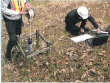
地下水観測孔の観測状況