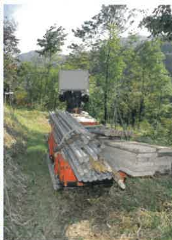
搬入車による機材搬入の例